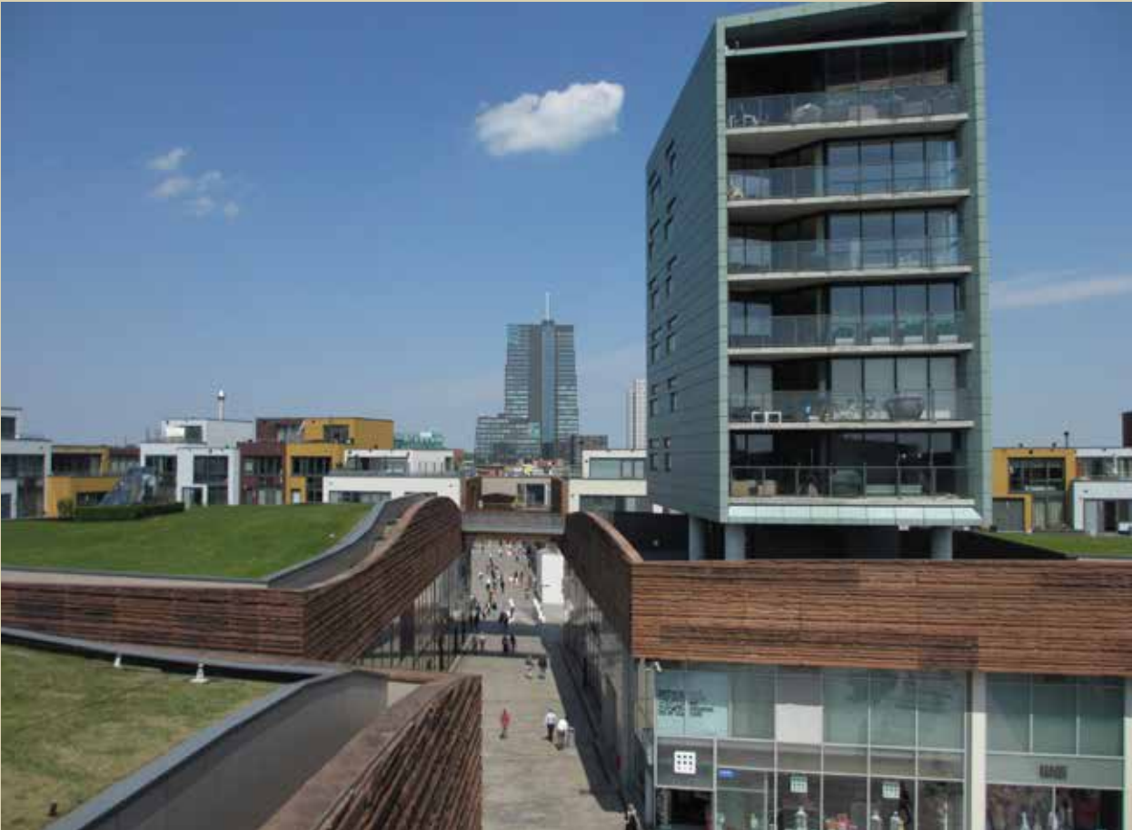
Foto: Almere centrum

is volgeboekt, dan behouden wij ons het recht voor u te plaatsen in een ander programma. U krijgt na aanmelding een automatische bevestiging per email. Deze bevestiging dient als toegangsbewijs voor het congres.